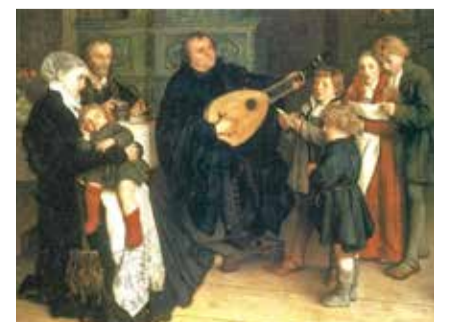
Luther musicceert met vrouw en kinderen