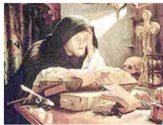
Sir Paton, 'Luther in Erfurt' (1861)

ACTIVITEITEN • Op 31 oktober 1517 heeft Luther met zijn 95 stellingen (in het Latijn) het gesprek aangekaart met zijn collega's in Wittenberg over een aantal misstanden in de kerk. Waarschijnlijk zijn ze ook opgehangen aan de deuren van de slotkapel, destijds een 'prikbord' van de universiteit. Later is deze daad geduid als het startpunt van de Reformatie.