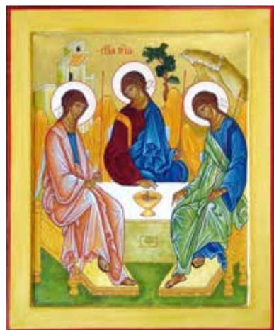
Andrej Roeblov, icoon 'de Heilige Drie-eenheid' (1410)