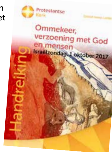
Voor handreiking en informatie W www.protestantsekerk.nl/themas/kerk-en-israel/israelzondag

volk Israël, is er bezinning op de relatie van de Kerk met Israël, en gebed voor dit volk. In dienen, leren en vieren zoekt de Kerk de relatie met het Joodse volk. In 1949 stelde de hervormde synode de Israëlzondag in, net na de Tweede Wereldoorlog en de vestiging van de staat Israël. Met de opbrengst van de collecte deze zondag wordt onder meer de christelijke leef- en werkgemeenschap Nes Ammim gesteund en in eigen land het OJEC dat het gesprek tussen joden en christenen stimuleert.