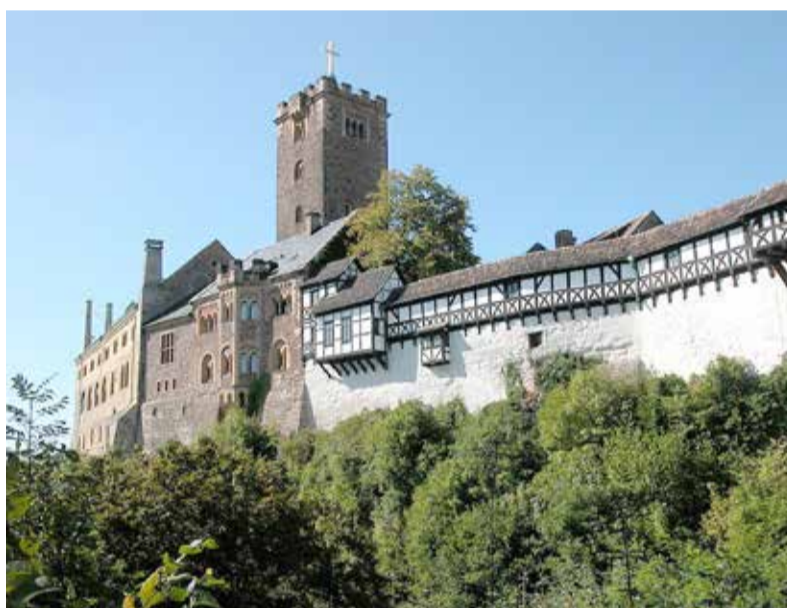
De Wartburg in Eisenach, de 'werkplaats' van Maarten Luther